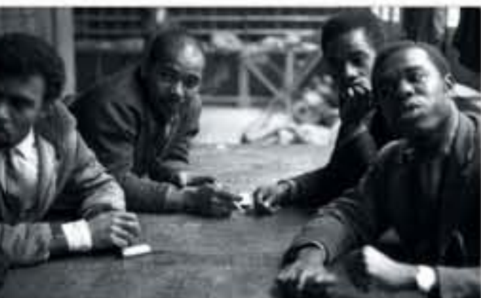
Travailleurs antillais aux PTT, 1964.

Gaston Monnerville est la personnalité politique ultramarine qui a obtenu le plus haut poste dans les institutions françaises au XX e siècle. D'origine guyanaise, il débute sa carrière politique comme député au lendemain d'un procès retentissant à Nantes (1932) pour défendre les « insurgés guyanais ». Il est ensuite nommé au poste de secrétaire d'État aux Colonies en 1937, après Blaise Diagne et Gratien Candace. Après guerre, il est élu au Sénat, avant de devenir président du Sénat de la Communauté (1959-1960) puis président du Conseil de la République et du Sénat jusqu'en 1968, le deuxième poste en niveau d'importance de la IV e République. Il entre dans l'opposition quand le général de Gaulle propose l'élection du président de la République au suffrage universel direct et appelle à voter François Mitterrand en 1965. Il termine sa carrière au Conseil constitutionnel.