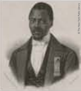
Louisy Mathieu, représentant de la Guadeloupe à l'Assemblée nationale, lithographie signée Louis Soulange-Teissier, 1848.

« Combien de temps faudra-t-il attendre le temps bienheureux où les anthropologues et philosophes modernes [...], cesseront de fabriquer des études dont le seul but est de calomnier des races opprimées. »