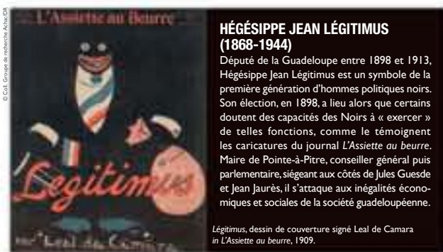
HÉGÉSIPPE JEAN LÉGITIMUS (1868-1944)

Député de la Guadeloupe entre 1898 et 1913, Hégésippe Jean Légitimus est un symbole de la première génération d'hommes politiques noirs. Son élection, en 1898, a lieu alors que certains doutent des capacités des Noirs à « exercer » de telles fonctions, comme le témoignent les caricatures du journal L'Assiette au beurre . Maire de Pointe-à-Pitre, conseiller général puis parlementaire, siégeant aux côtés de Jules Guesde et Jean Jaurès, il s'attaque aux inégalités économiques et sociales de la société guadeloupéenne.