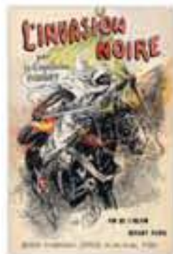
L'invasion noire, couverture du livre du capitaine Danrit, 1895.