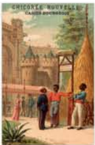
Calédonie, chromolithographie pour la Chicorée Nouvelle, 1889.