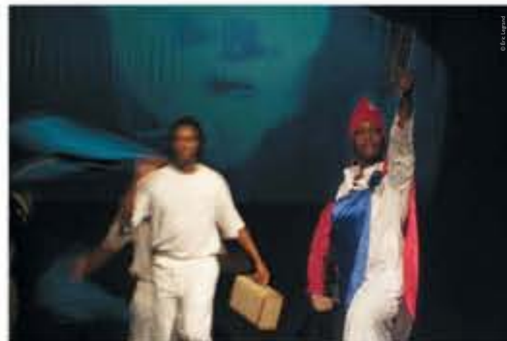
Vive la France ! de Mohamed Rouabhi [Théâtre Gérard-Philipe, Saint-Denis], photographie d'Éric Legrand, 2008.