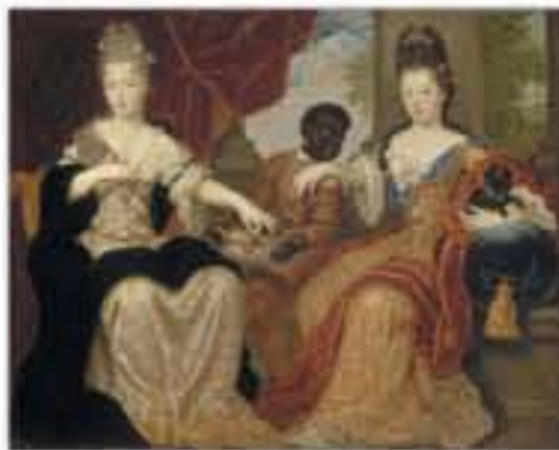
Mademoiselle de Blois et Mademoiselle de Nantes servies par leur domestique noir, huile sur toile signée Claude-François Vignon, 1697.