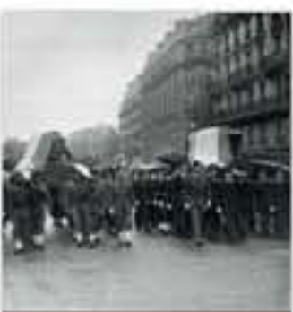
Transfert des cendres de Victor Schœlcher et de Félix Éboué au Panthéon, photographie, 1949.