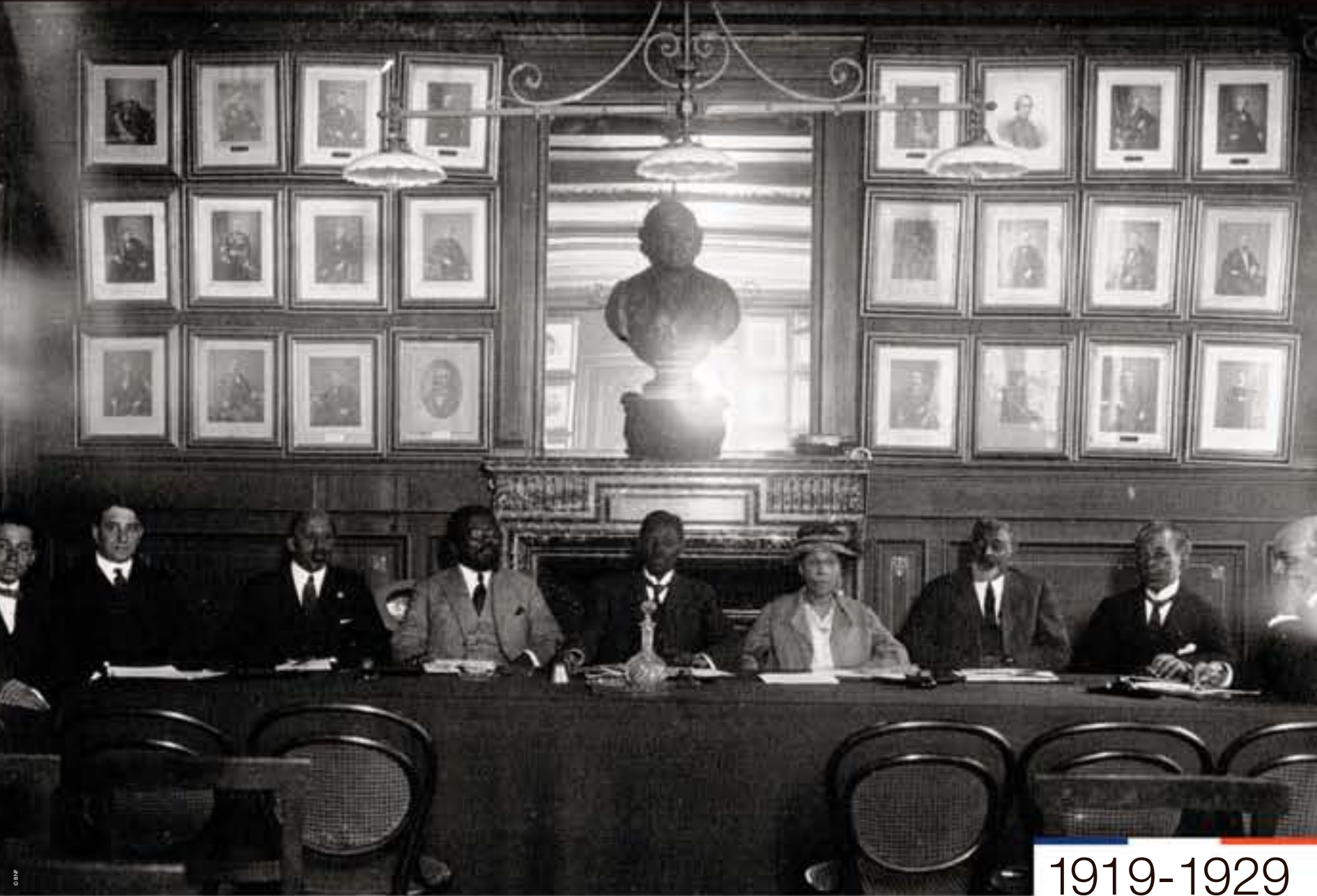
Deuxième congrès de la race nègre à Paris, photographie de l'agence Meurisse, 1921.