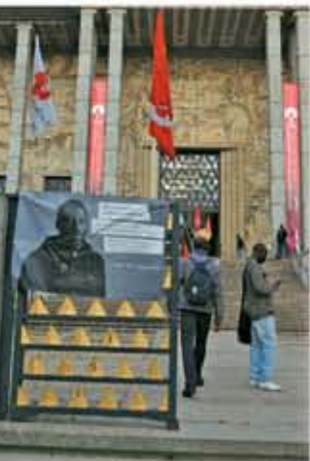
Occupation de la Cité nationale de l'histoire de l'immigration par des sans-papiers [Paris], 2010.