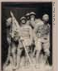
Monument aux héros de l'Armée noire détruit par les Allemands en 1940, photographie, non datée.

Inauguré le 13 juillet 1924 à Reims par Edouard Daladier, ministre des Colonies, ce monument porte les noms des principales batailles où les troupes africaines ont été engagées pendant la Première Guerre mondiale, et possède un double à l'identique à Bamako. Il fut détruit par les Allemands lors de la campagne de 1940 et, depuis 2008, plusieurs projets s'engagent pour le rebâtir afin de rendre hommage aux soldats noirs qui ont combattu pour la France.