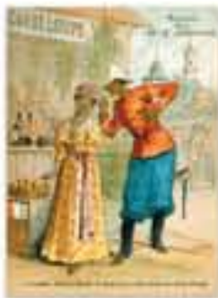
Exposition universelle, Guadeloupe, chromolithographie publicitaire pour la Maison de la Belle Jardinière, 1889.