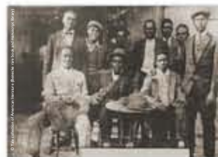
Groupe de Jazz à Marseille, photographie de Claude McKay, c. 1929