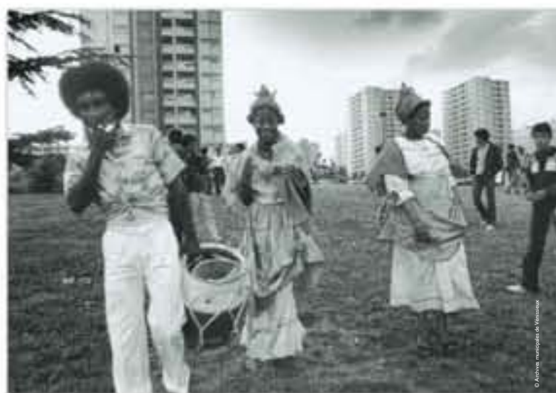
Nouveaux ensembles des Minguettes, la communauté antillaise [Vénissieux], photographie de Josette Vial, 1975.

« Tout homme est censé avoir été en France. Alors, soit pour faire des études, soit pour travailler, réunir un pécule [...]. Un homme vrai est celui qui a été en France. »