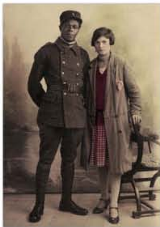
À Paris, un soldat colonial originaire des Antilles ou des « Quatre communes » du Sénégal et sa compagne, photographie de studio, 1919.