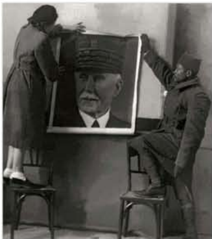
Association des amitiés africaines, Camp de Sathonay, photographie de propagande de l'AAA, 1942.