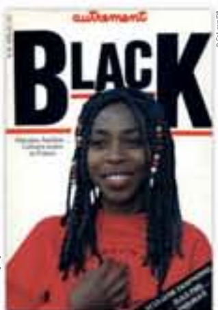
« Black: Africains, Antillais... Cultures noires en France », couverture in Autrement, 1983.