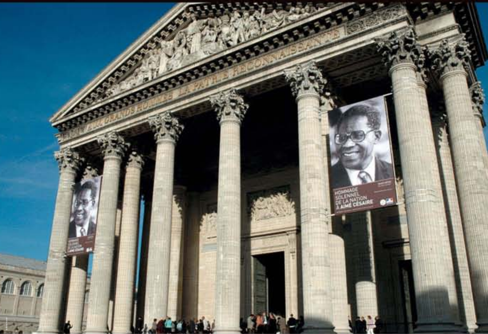
Hommage à Aimé Césaire au Panthéon, 2011.