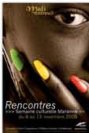
5 e semaine culturelle malienne de Montreuil, affiche signée Hyperbold, 2008.

« La seule chose qui change quand on a une origine africaine, c'est qu'on est noir, c'est visible. »