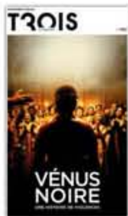
« Vénus noire. Une histoire de violences », couverture in supplément spécial Trois couleurs, 2010.