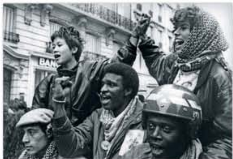
Marche contre le racisme à Paris, 1983.