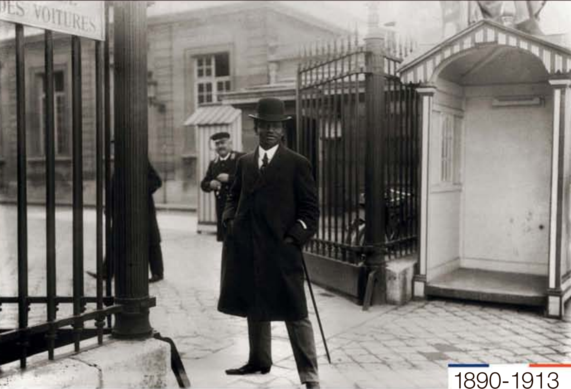
Hégésippe Jean Légitimus devant le Palais-Bourbon, 1909.