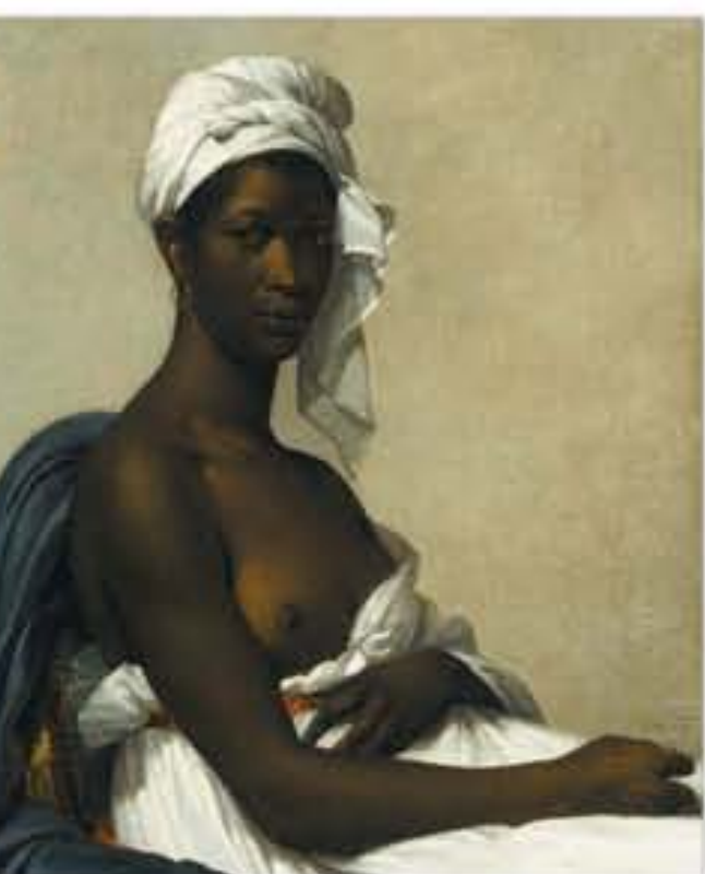
Portrait de négresse, peinture signée Marie Guillermine, 1800.