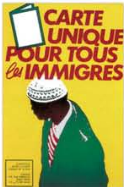
Carte unique pour tous les immigrés, affiche de la Cimade, 1982.