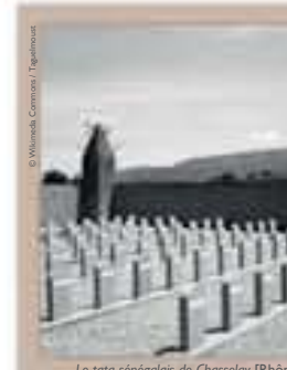
Le tata sénégalais de Chasselay [Rhône], photographie, non datée.