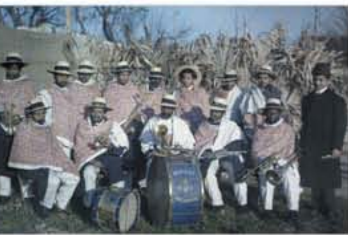
Groupe de Malgaches à l'exposition de Marseille, photographie, 1906.

Légitimus, dessin de couverture signé Leal de Camara in L'Assiette au beurre , 1909.