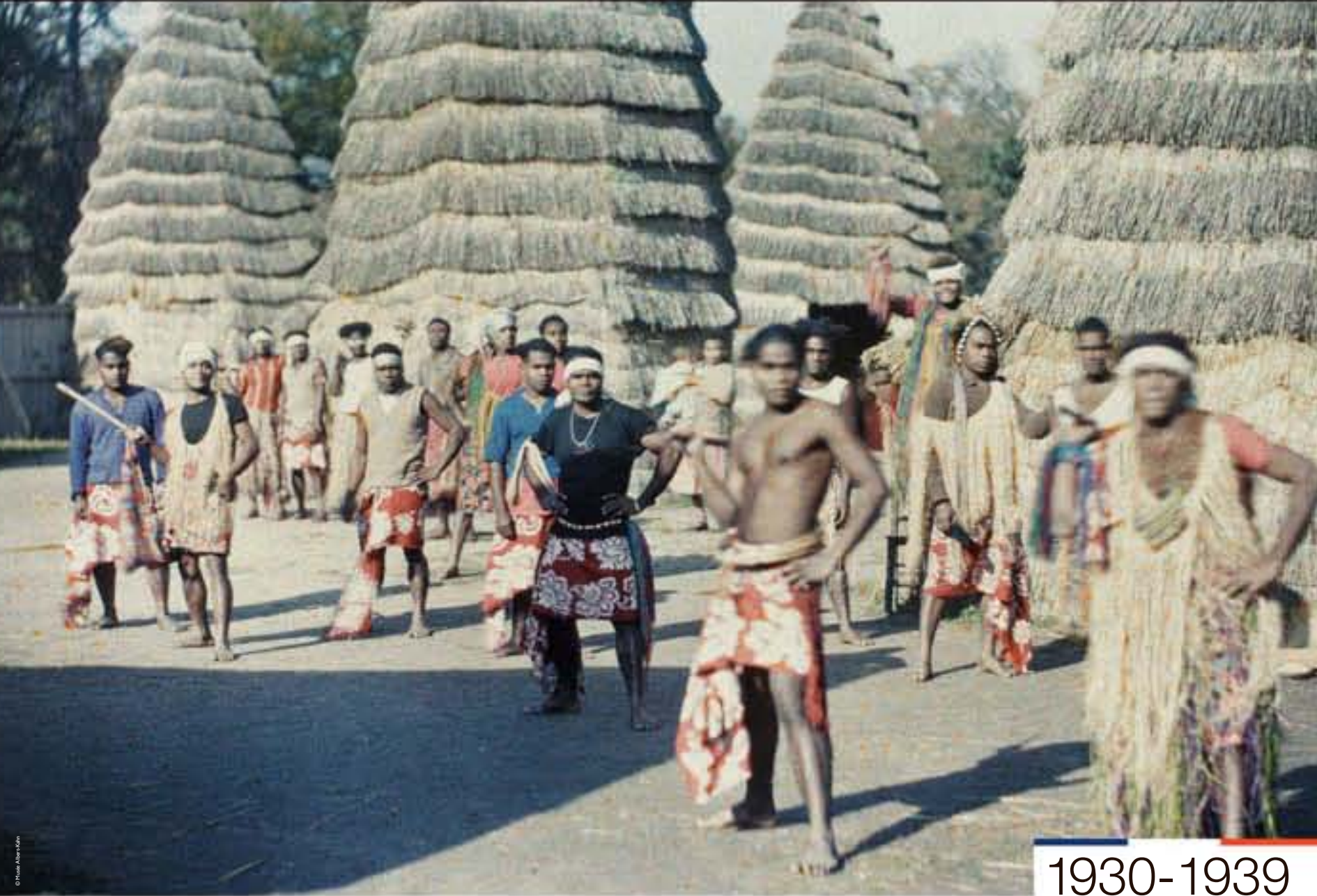
L'exposition coloniale de Paris. Village canaque de Nouvelle-Calédonie, photographie, 1931.