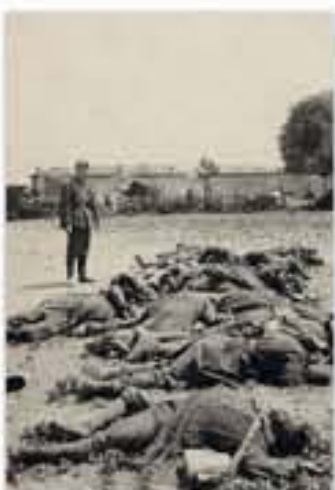
Corps de tirailleurs sénégalais après une exécution collective dans la Somme, photographie de source allemande, 1940.