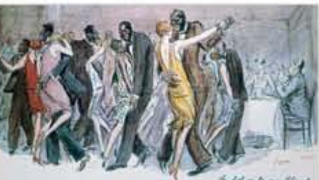
Le bal de la rue Blomet à Paris, aquarelle signée Sem, 1928.

En 1925, l'Afro-Américaine Joséphine Baker enfamme le public avec sa « danse nègre ». Presque nue, avec sa ceinture en « régime de bananes », sa gestuelle énergique mêle charleston et contorsions africaines. Son spectacle fait l'effet d'une « bombe » tant au niveau culturel que pour la représentation des Noirs en France et elle devient une star du public français. Personnalité du Tout-Paris et de la nuit, elle s'impose en France en tant qu'artiste noire, un statut que la ségrégation aux États-Unis lui interdisait.