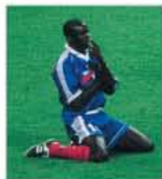
Lilian Thuram lors de la demi-finale France-Croatie, photographie, 1998.