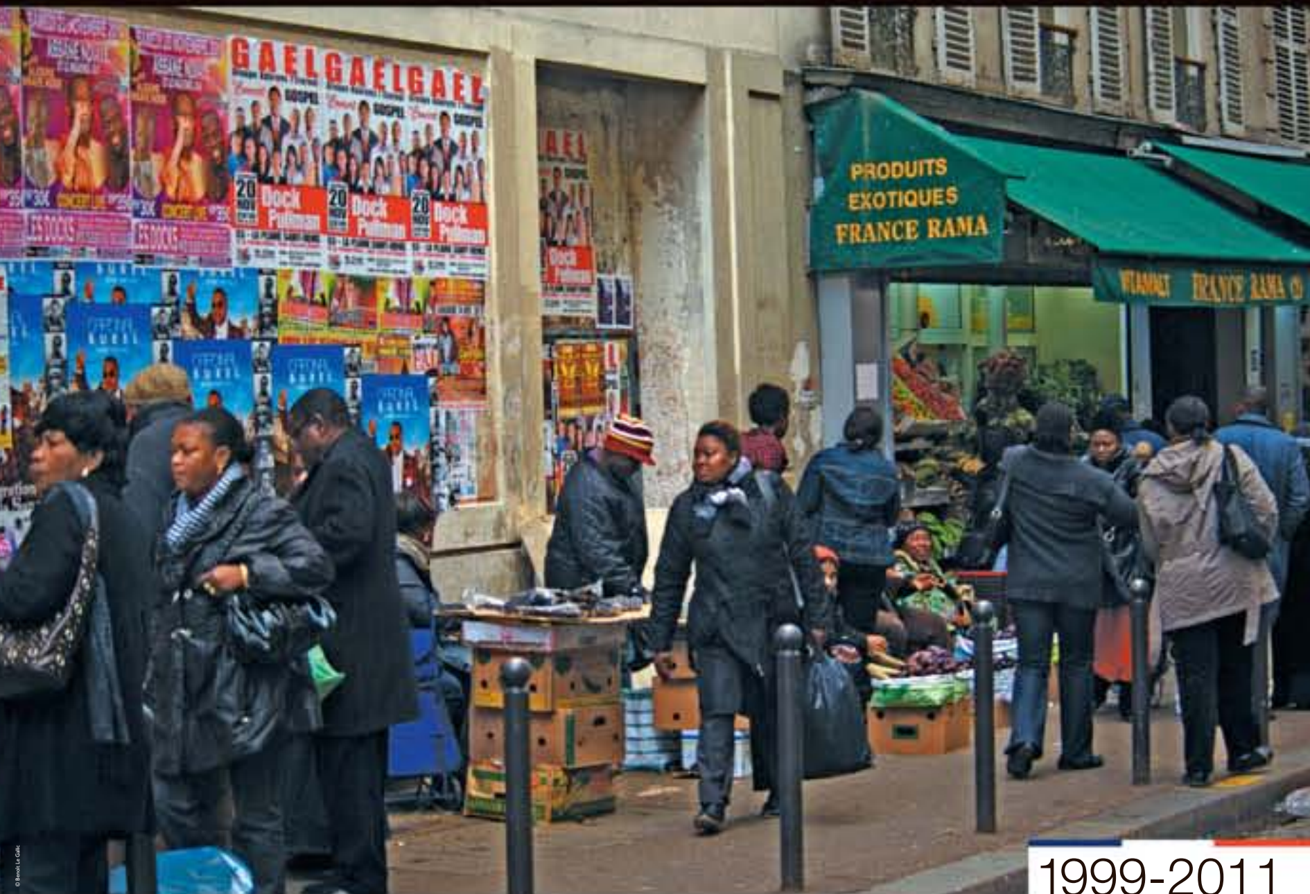
Commerce de produits exotiques, photographie de Benoit Le Gallic, 2011.