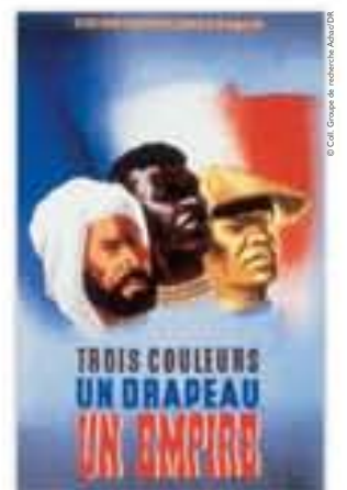
Trois couleurs, un drapeau, un empire, affiche signée Éric Castel, éditée par le secrétariat d'État aux Colonies, 1941.

« Nos compatriotes ont personnifié la France qui refuse d'être battue, la France qui refuse d'être esclave... »