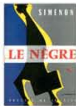
Le Nègre, couverture du roman de Georges Siménon, 1957.