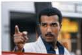
Pascal Légitimus, photogramme extrait du film L'œil au leur(e) noir de Serge Meynard, 1987.

Lilian Thuram, né en Guadeloupe, est un ancien footballeur international français. Son palmarès (le plus capé des Bleus), ses titres (comme la Coupe du monde en 1998) le font considérer comme l'un des meilleurs défenseurs français de tous les temps. Mais, il s'est également illustré pour ses prises de position politiques et culturelles, en qualité de membre du Haut Conseil à l'intégration et pour la lutte contre le racisme et l'antisémitisme. Son ouvrage Mes étoiles noires tente de combler un vide en faisant la lumière sur les contributions de plusieurs personnalités noires à l'attention d'un large public, que prolonge son action au sein de la fondation qu'il a créée en 2008.