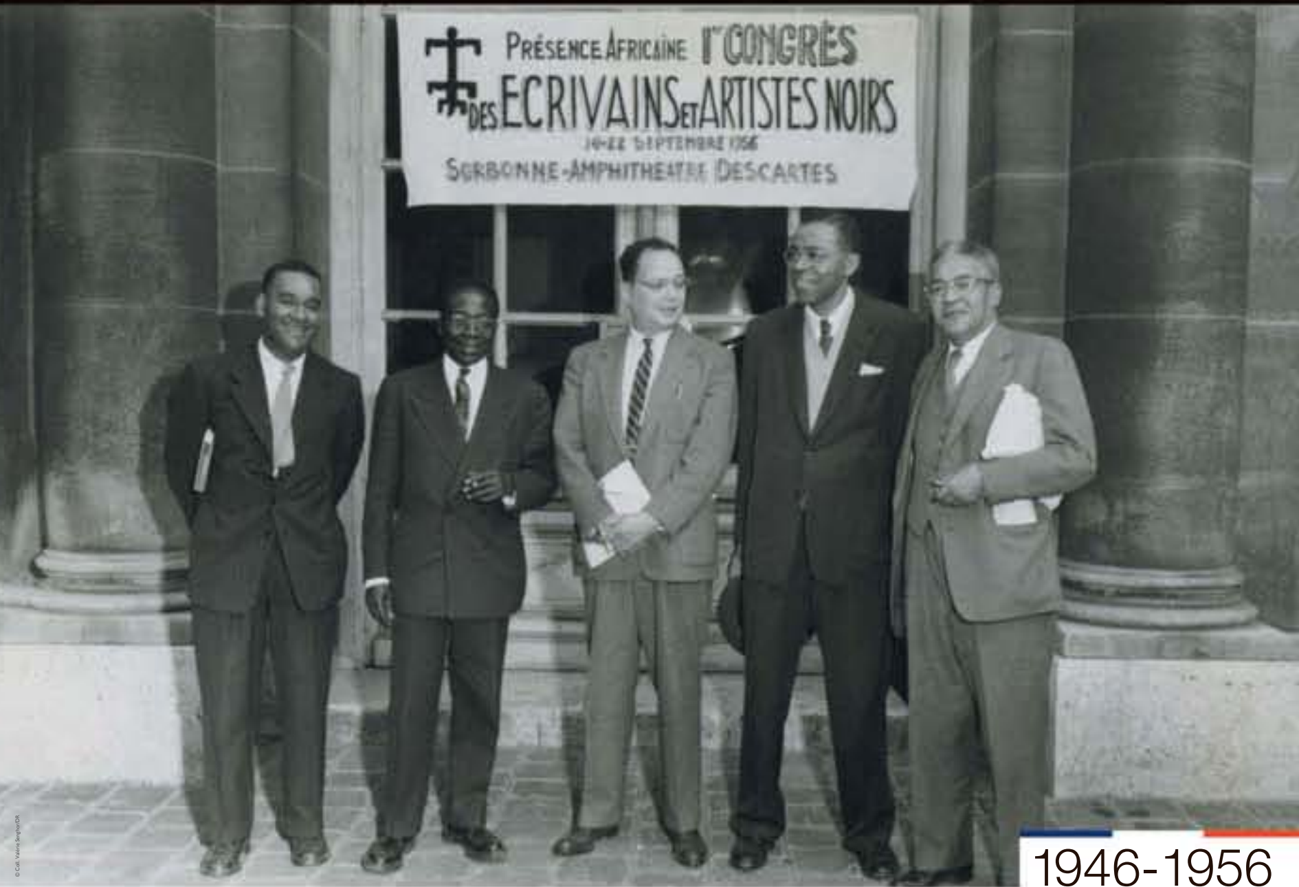
Premier Congrès international des écrivains et artistes noirs, Richard Wright, Léopold Sédar Senghor, Aimé Césaire [Paris], photographie, 1956.