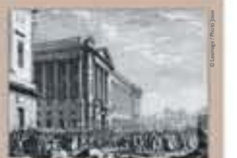
Pillage des armes au garde-meuble royal, place de la Concorde, gravure, 1789.

Situé place de la Concorde, ce bâtiment achevé en 1774 servait à l'origine de garde-meuble royal avant d'abriter, à compter de 1789, le ministère de la Marine. En 1848, y fut rédigé le texte préparatif à la loi sur l'abolition de l'esclavage initié par Victor Schoelcher, sous-secrétaire d'État à la Marine.