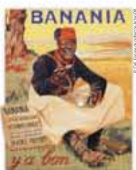
Banania, affiche signée De Andreis, 1915.