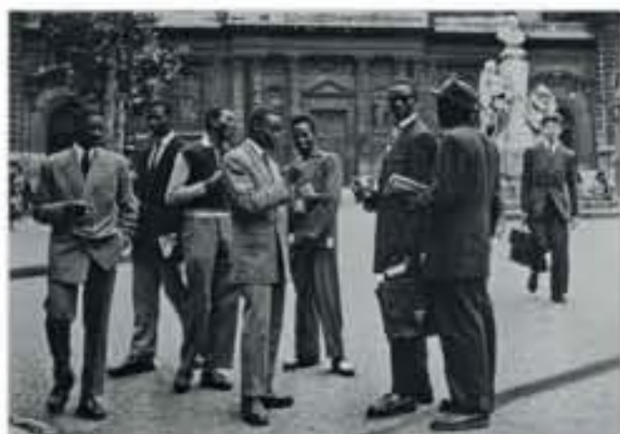
Étudiants africains devant la Sorbonne, photographie, c. 1955.

« Contribuer à faire entrer sur la scène de l'Histoire les intellectuels nègres, africains et antillais »