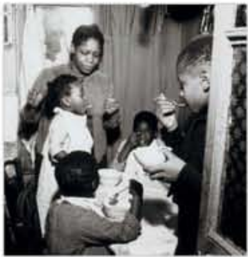
Famille africaine habitant dans un taudis à Paris, photographie, 1947.

Le Sénégalais Aloune Diop (1910-1980) crée en 1947 la revue Présence Africaine , véritable forum pour l'émergence d'une culture africaine indépendante. Elle devient un moteur intellectuel et offre une tribune aux figures noires du monde littéraire et politique tout en attirant l'adhésion de l'intelligentsia française. Il organise le premier Congrès des écrivains et artistes noirs à la Sorbonne, où des textes de Roger Bastide et Claude Lévi-Strauss sont lus en ouverture. Aimé Césaire en fixe la perspective politique : « Laissez entrer les peuples noirs sur la grande scène de l'Histoire. » Par son action, Aloune Diop assure une liaison féconde de créations entre toutes les diasporas noires.