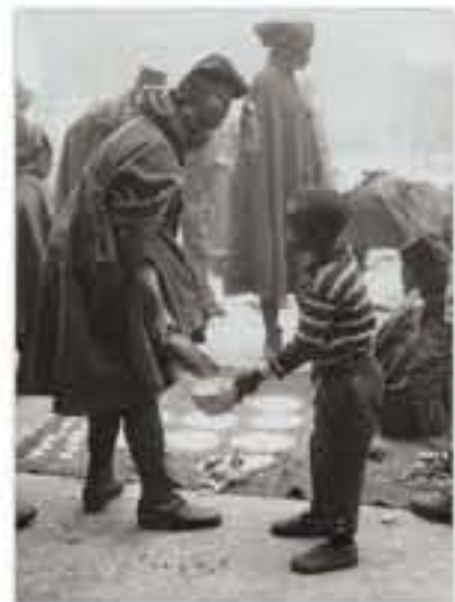
Partage de vivres [Marseille], photographie, 1913.