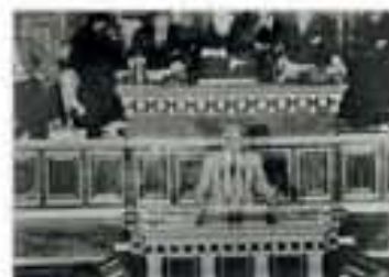
Gaston Monnerville, président du Sénat, photographie, 1965.