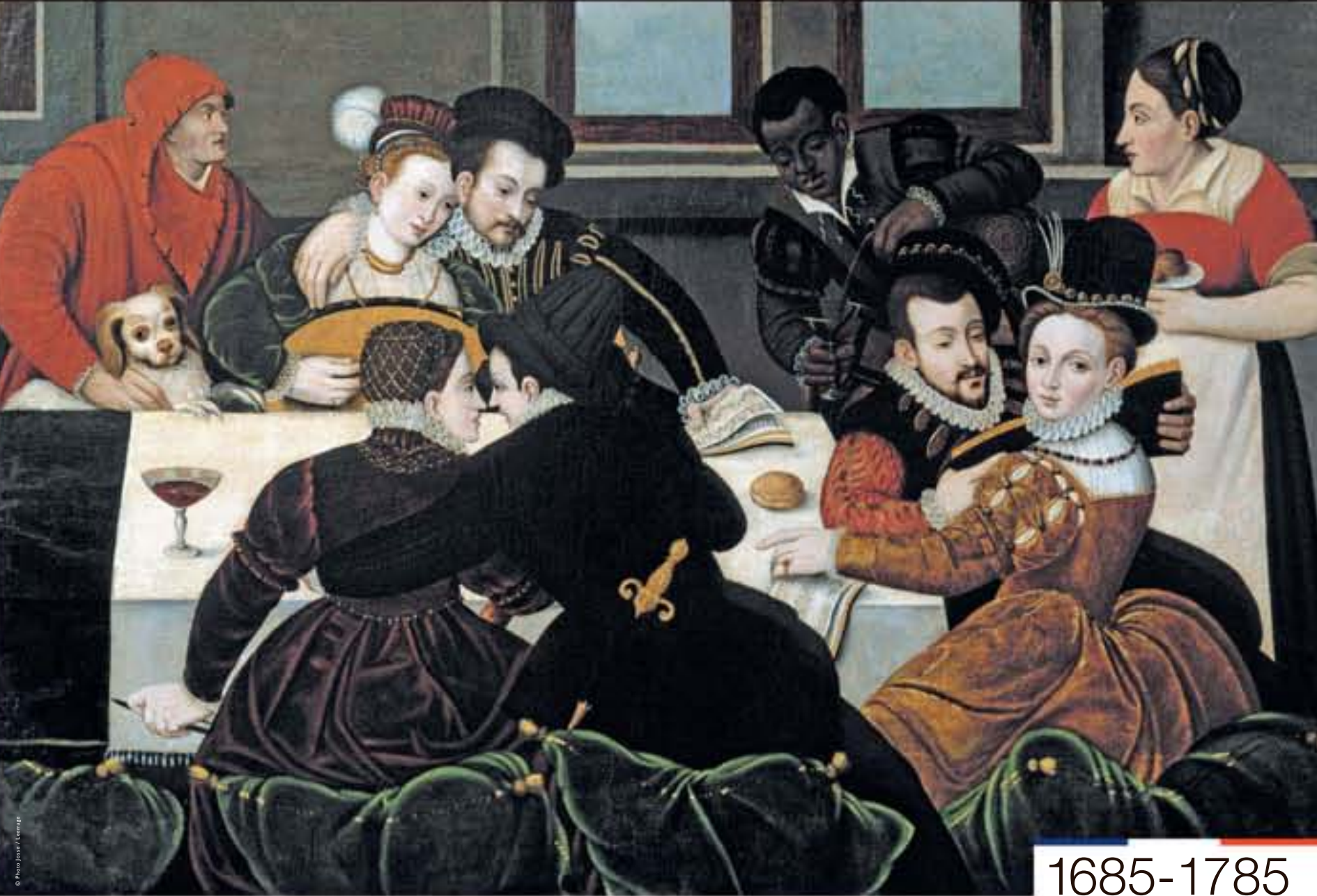
Le repas galant, peinture de l'École de Fontainebleau, c. 1540.