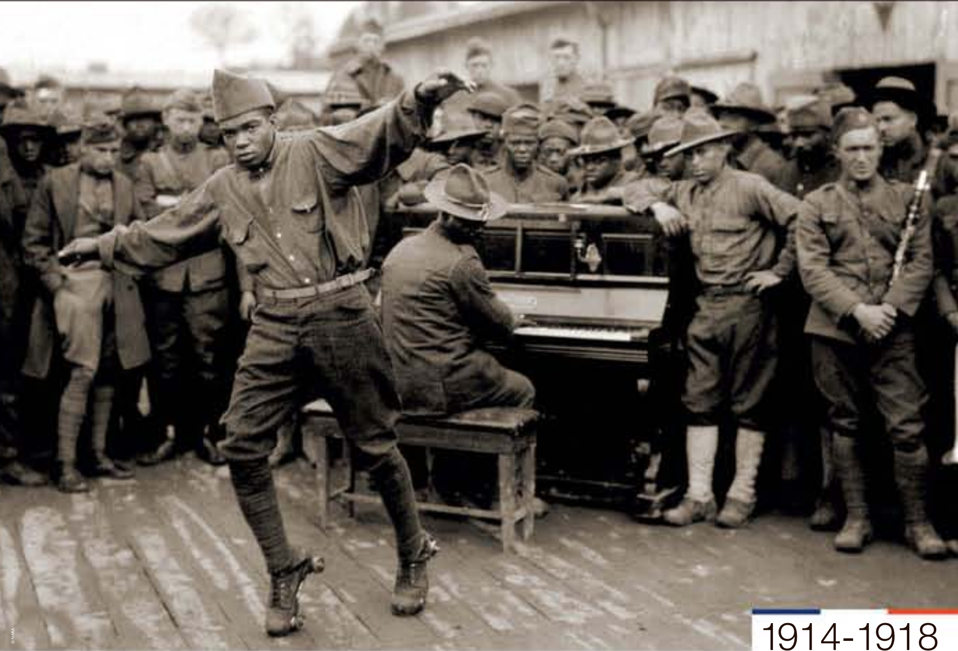
Entertaining the boys with fancy dancing on roller skates [Bordeaux], 1918.