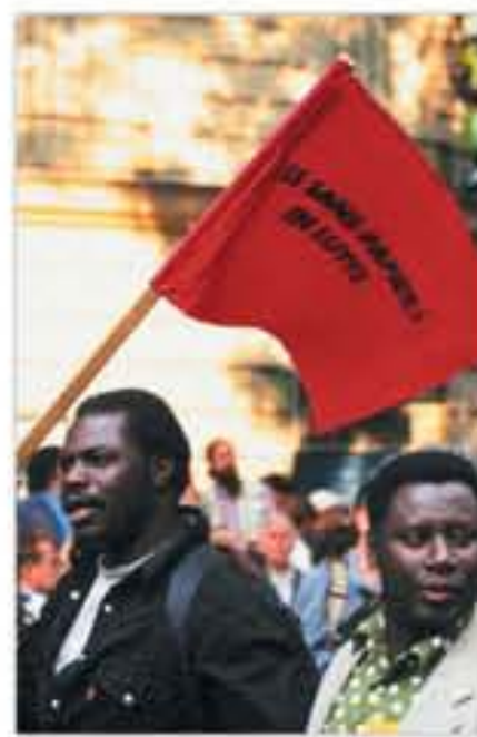
Manifestation de soutien aux sans-papiers [Paris], 1996.