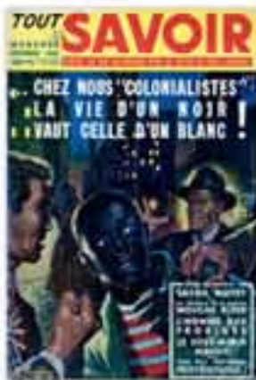
« Chez nous "colonialistes", la vie d'un Noir vaut celle d'un Blanc ! », couverture in Tout savoir, 1955 [décembre].