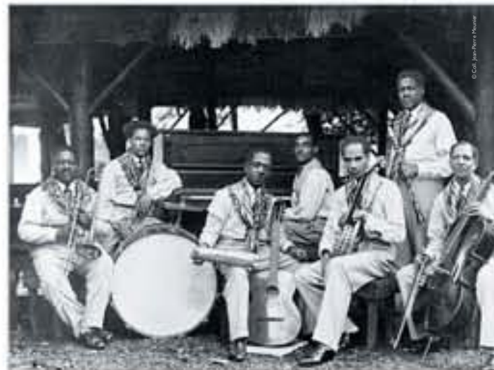
Orchestre Stello de l'Exposition coloniale, photographie, 1931.

« On y trouve toutes les races, noire, jaune, blanche, mais c'est la noire qui domine. »