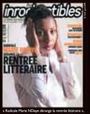
« Radicale Marie NDiaye dérange la rentrée littéraire », couverture in Les Inroductibles , 2009 [solu].

Marie NDiaye est une femme de lettres française, qui a obtenu le prix Goncourt en 2009 pour le roman Trois femmes puissantes et la seule femme écrivain vivante à avoir sa pièce de théâtre ( Papa doit manger ) au répertoire de La Comédie-Française . Fille de Sénégalais, elle refuse une association avec une identité africaine puisqu'elle a été éduquée dans un environnement complètement français. Néanmoins, elle s'est retrouvée face à l'impossibilité d'une neutralité « de posture » lorsqu'un député UMP lui demanda de modérer ses propos alors qu'elle avait ouvertement pris position contre la politique de l'immigration du président de la République Nicolas Sarkozy.