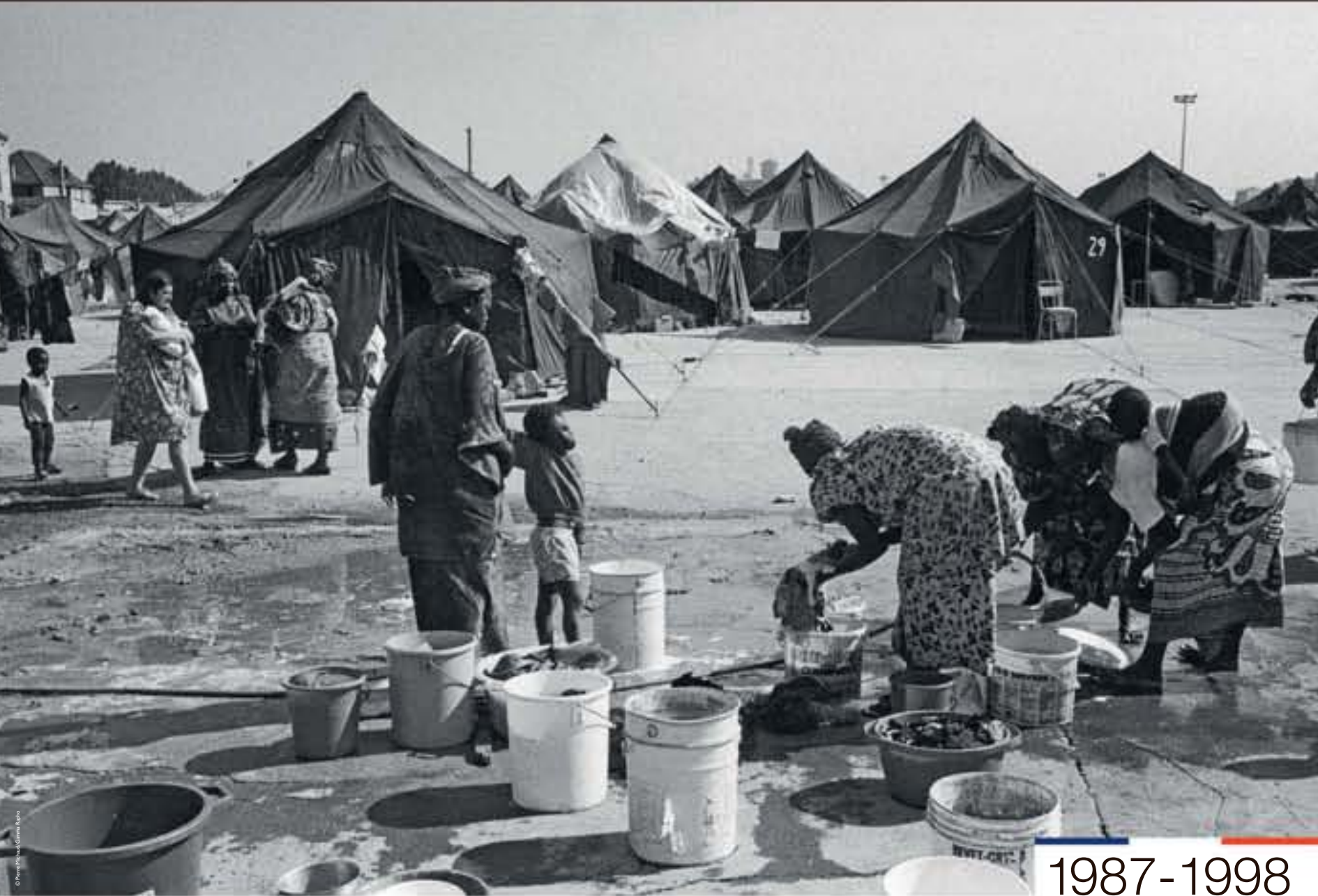
Camp de réfugiés sans-papiers, photographie de Pierre Michaud, non datée.