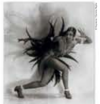
Joséphine Baker à Paris, photographie de studio, 1926.