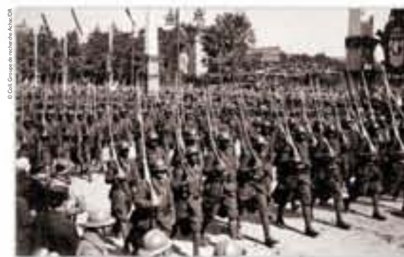
Les fêtes de la Victoire du 14 juillet. Troupes noires, carte postale, 1919.

Né en 1872 sur l'île de Gorée au Sénégal, Blaise Diagne est le premier député africain élu à la Chambre des députés française en 1914. Il obtient, pour les habitants des « Quatre Communes », la citoyenneté en échange de leur conscription en 1916. En 1917, le député Diagne s'indigne contre le fait que les troupes noires soient utilisées par Charles Mangin comme de la « chair à canon ». Pourtant, en 1918, il devient Commissaire général chargé du recrutement indigène en Afrique. En choisissant de soutenir l'entreprise coloniale de la France, il est nommé sous-secrétaire d'État aux Colonies au début des années 30 et, dans le cadre de ses fonctions, il inaugure l'Exposition coloniale internationale de 1931.