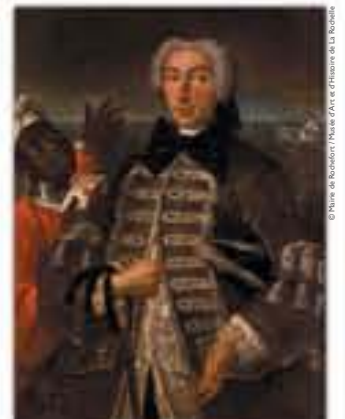
Portrait d'un officier de marine et de son esclave noir, huile sur toile de l'École française, c. 1750.