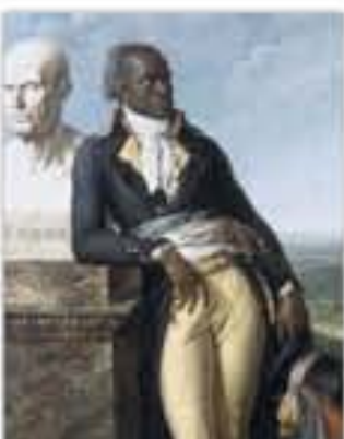
Portrait de Jean-Baptiste Belley, député de Saint-Domingue, peinture signée Anne-Louis Girodet de Roussy-Trioson, 1797.