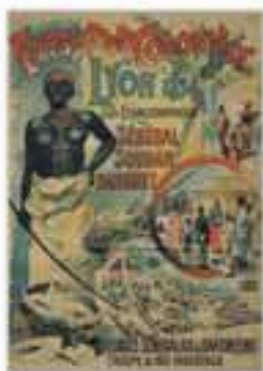
Exposition coloniale de Lyon. Villages sénégalais et d'ohoméens, affiche signée Francisco Tamagno, 1894.