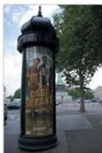
Case départ à l'effiche, photographie de Benoît Le Gallic, 2011.