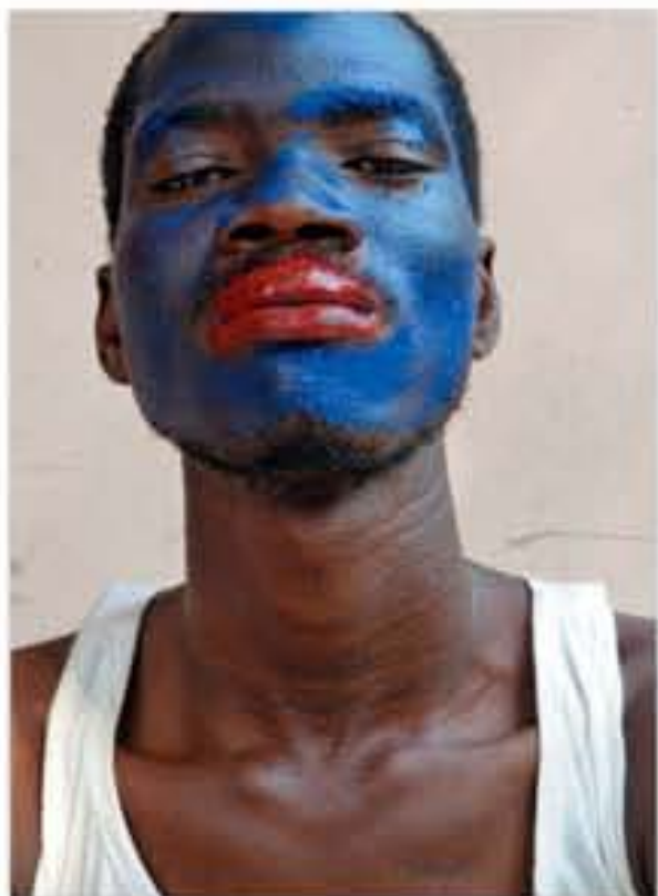
Les Nègres de Jean Genet [Les Nuits de Fourvière], 2011.