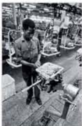
Ouvrier africain dans un atelier des usines Ford à Blanquefort, photographie de Richard Phelps Friedman, c. 1970.