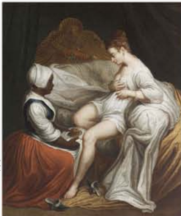
La toilette intime, huile sur toile signée Jean-Antoine Watteau, c. 1720.