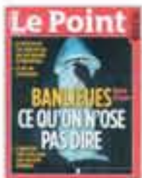
« Banlieues ce qu'on n'ose pas dire », couverture in Le Point , 2005 [novembre].