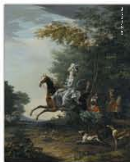
Marie-Antoinette chassant à courre, huile sur toile signée Louis-Auguste Brun, c. 1783.

« Octroyons aux affranchis les mêmes droits, privilèges et immunités dont jouissent les personnes nées libres... »