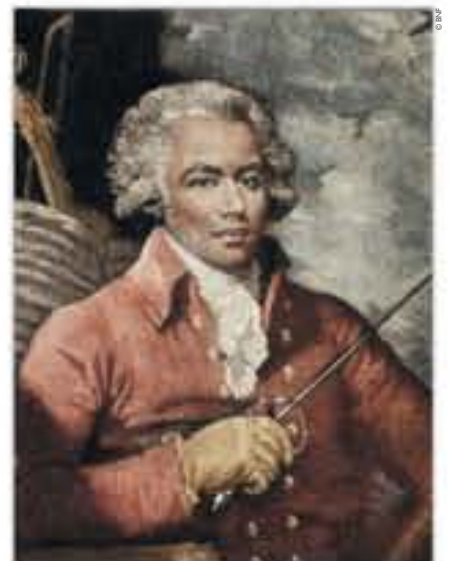
Joseph Bologne, chevalier de Saint-George, gravure signée Mather Brown, 1787.

Né en Afrique et vendu comme esclave à Saint-Domingue, il gagne sa liberté pour avoir servi dans l'armée lors de la guerre d'indépendance américaine. Élu député de Saint-Domingue en 1793, il contribue à faire voter la première abolition de l'esclavage. Il lutte contre l'indépendance de son île lors de la campagne contre Toussaint Louverture, il va participer activement à la répression, fidèle à son engagement anti-sécessionniste. De retour en France, il est incarcéré sous les ordres de Napoléon Bonaparte et meurt en captivité dans la forteresse de Belle-Île-en-Mer. Son portrait, réalisé par Anne-Louis Girodet en 1797, est la première représentation en France d'un homme noir dans une position officielle de législateur politique muni des codes de la fonction.