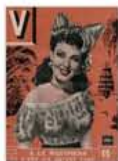
« La Martinique c'est ça qu'est chic », couverture in V, 1947.