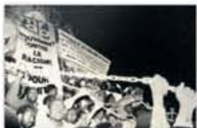
Mobilisation contre les expulsions [Paris], photographie de Claude Chambon, 1986.