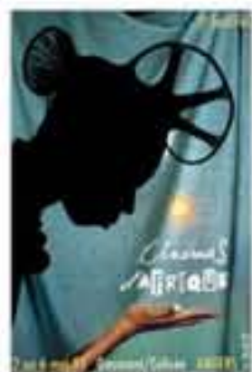
Cinéma d'Afrique, affiche du 5 e festival, 1995.