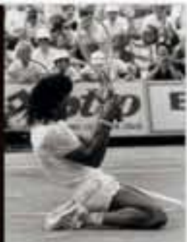
Yannick Noah après sa victoire en finale de Roland-Garros, photographie, 1983.

Né à Sedan, d'un père camerounais et d'une mère française, il est le symbole de la réussite des nouvelles générations et d'une « France métisse ». Sa victoire aux Internationaux de tennis de Roland-Garros en juin 1983 est un véritable événement populaire. Sa reconversion en tant que capitaine de l'équipe de France est un nouveau succès puisqu'il remporte la Coupe Davis en 1991 et 1996, puis la Fed Cup en 1997. Chanteur, impliqué dans différentes associations caritatives, il est aujourd'hui la « personnalité préférée » des Français.