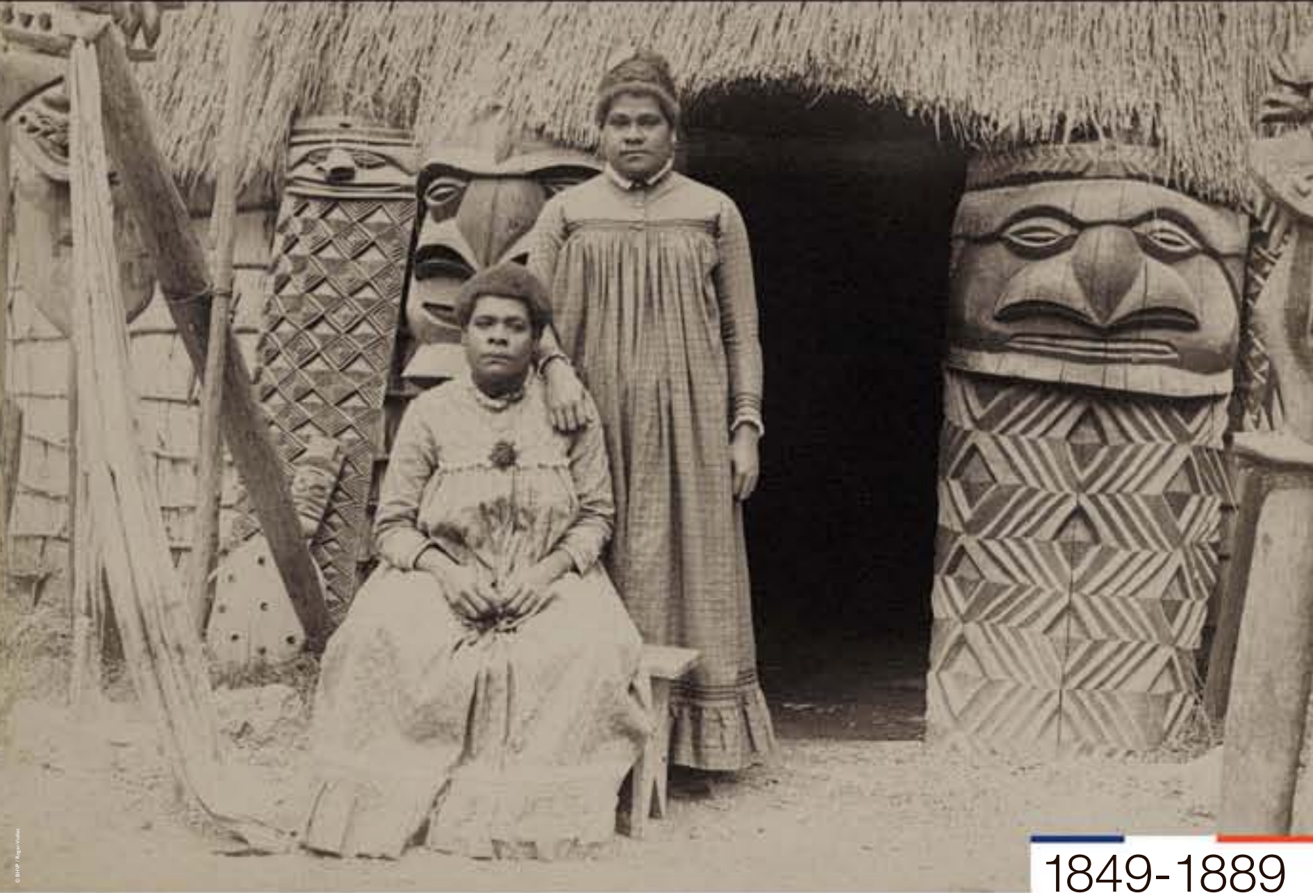
Exposition universelle de Paris. Deux femmes canaques, photographie, 1889.