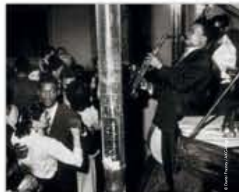
Orchestre de musiciens noirs au bal de la rue Blomet, photographie de Daniel Frasnay, 1955.

Félix Houphouët-Boigny fonde en 1946, dans la future Côte d'Ivoire, le Rassemblement démocratique africain (RDA), puis il sera nommé membre de la Commission des territoires d'outre-mer et propose plusieurs projets de loi, dont un sur la suppression du travail forcé adopté en 1947. Il veut réviser en profondeur le système des colonies, et s'engage pour que les peuples africains comme antillais soient mieux représentés et puissent faire l'apprentissage de leur autonomie. Il sera plusieurs fois ministre sous la IV e République. Premier président de la Côte d'Ivoire, Félix Houphouët-Boigny tient un rôle majeur dans le processus de décolonisation de l'Afrique.