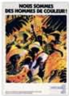
Nous sommes des hommes de couleur !, affiche signée André Langevin, non datée.