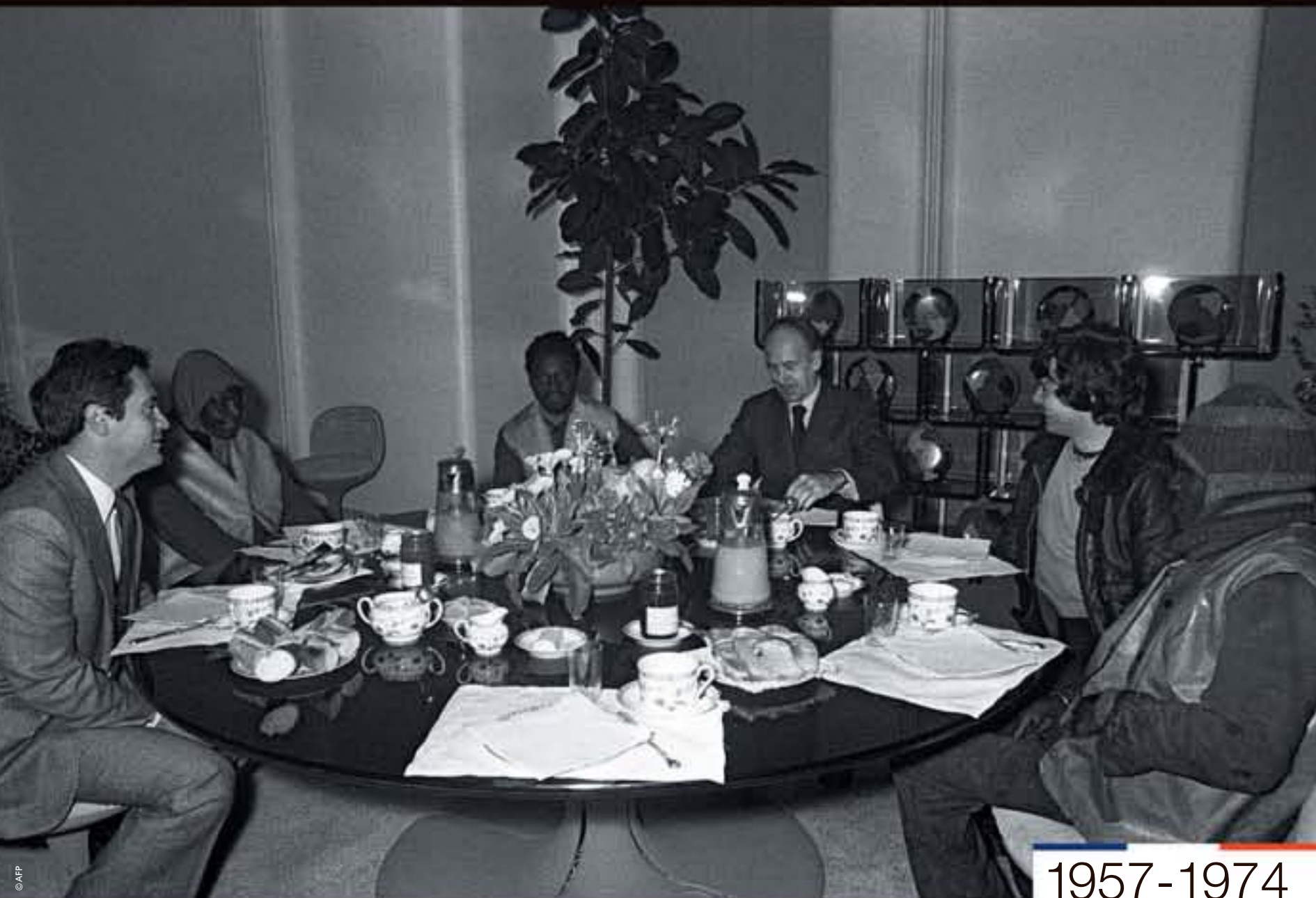
Le président de la République Valéry Giscard d'Estaing reçoit des éboueurs pour un petit déjeuner à l'Élysée, photographie, 1974.