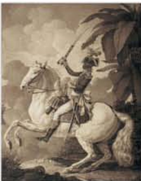
Portrait équestre de Toussaint Louverture sur son cheval Bel-Argent, peinture signée Denis A. Volozan, 1802.