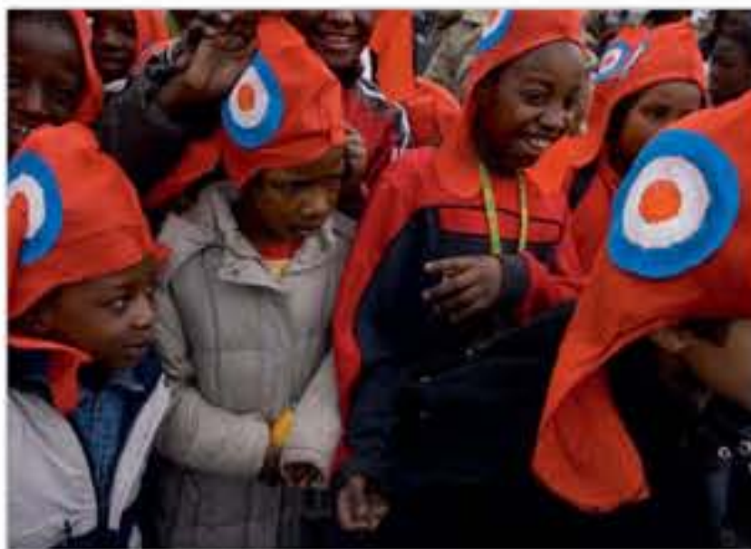
Cocarde et bonnets pendant le carnaval de Sarcelles, photographie de Xavier Zimbaro, 2005.