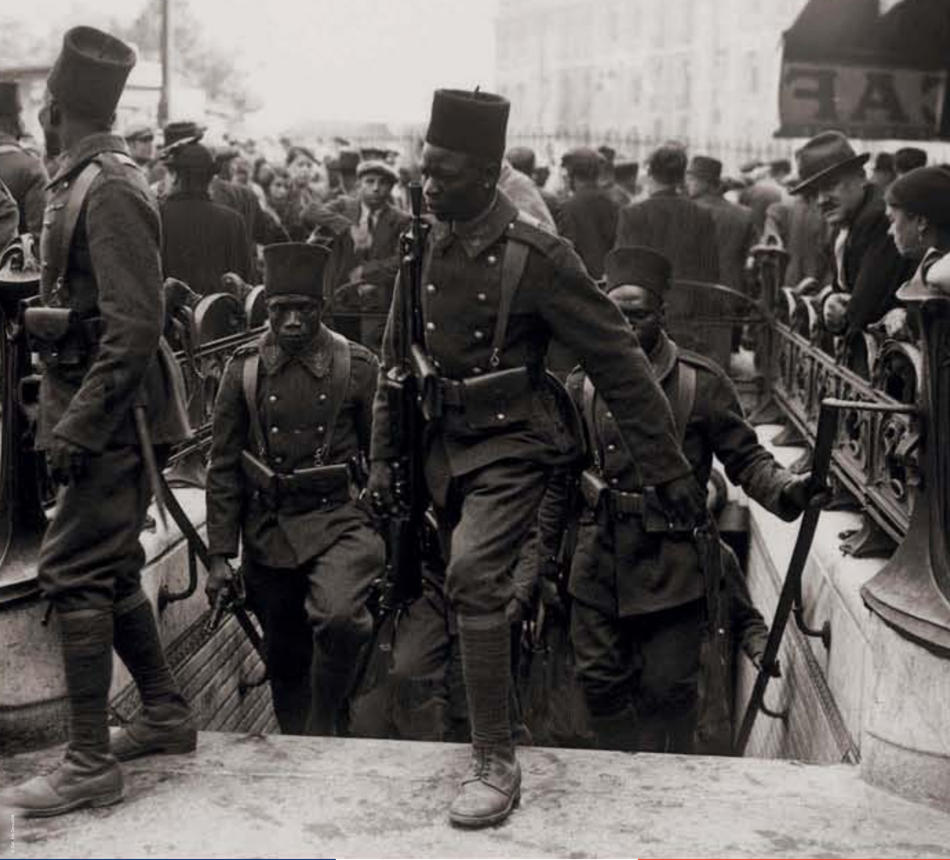
Le 12 e Régiment de tirailleurs sénégalais venu pour les cérémonies du 14 juillet, photographie de Meurice, 1939.