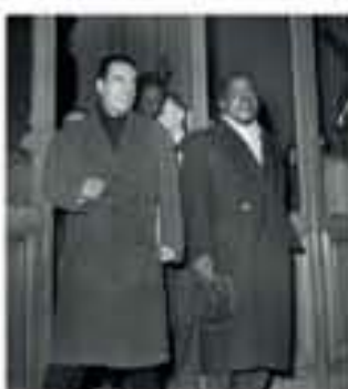
Félix Houphouët-Boigny et François Mitterrand, photographie, 1956.