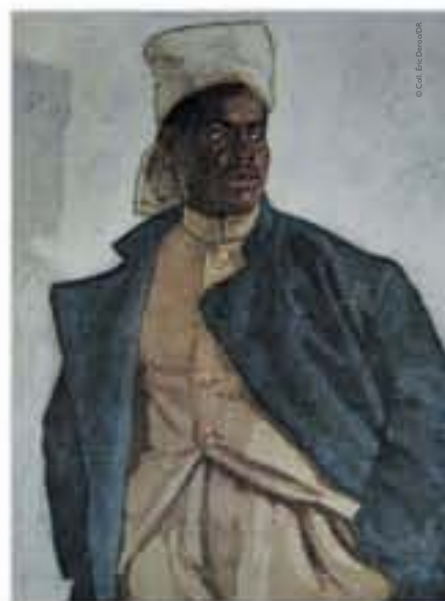
Guadeloupéen, peinture, c. 1917.