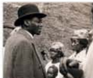
Blaise Diagne, homme politique d'origine sénégalaise, photographie, 1931.