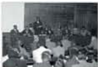
Allocation d'Aloune Diop au premier Congrès des écrivains et artistes noirs, 1956.