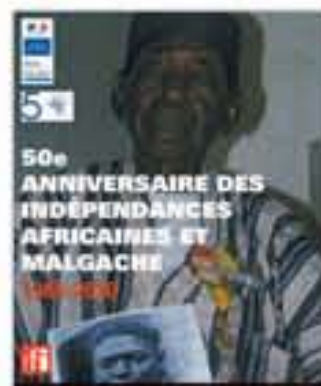
50 e anniversaire des indépendances africaines et malgache, dépliant du programme, 2010.

Les troupes des anciennes colonies africaines de la France ont ouvert le défilé du 14 juillet 2010 sur les Champs-Élysées, cinquante ans après leurs indépendances. Un peu moins de cinq cents soldats africains ont défilé devant les autorités françaises et africaines et le public. L'événement est symbolique, mais souligne aussi la faiblesse des actions et événements pour cette année commémorative du 50 e anniversaire des indépendances des anciennes colonies de la France en Afrique qui ne resteront dans les mémoires qu'à travers de cet événement militaire.