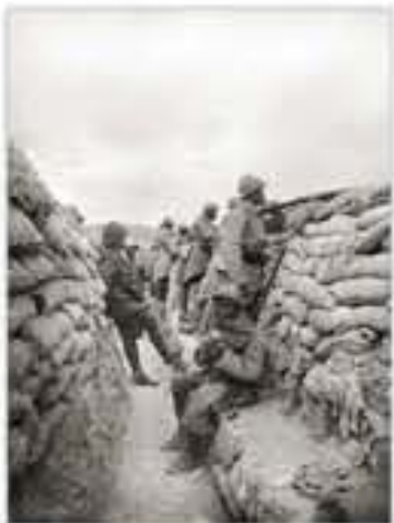
Tirailleurs sénégalais sur le front de l'Argonne [Champagne-Ardenne], 1916.

« Certains hommes se détachent de la foule et viennent nous serrer les mains. Je les entends dire : « Bravo les tirailleurs sénégalais ! Vive la France !... » »