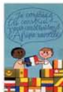
Je construis, tu construis... Nous construisons l'Afrique nouvelle, affiche signée Massacrier pour le ministère de la Coopération, 1962.

« Nous aimons Paris parce qu'on peut plus que chez nous dire ce qu'on pense. »