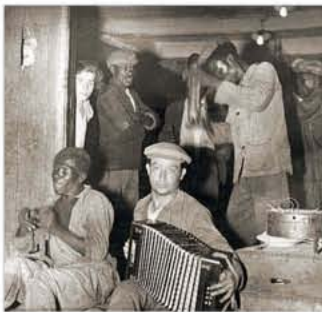
Dockers de la rue Torte [Marseille], photographie de Baudelaire, c. 1925.