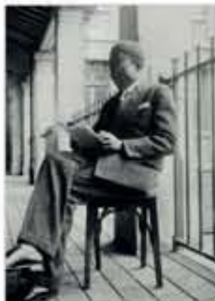
Léopold Sédar Senghor au lycée Louis-le-Grand à Paris, photographie, 1929.