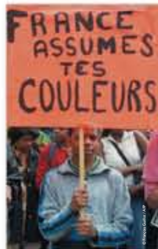
France assumes tes couleurs, photographie de François Guillot, 2000.