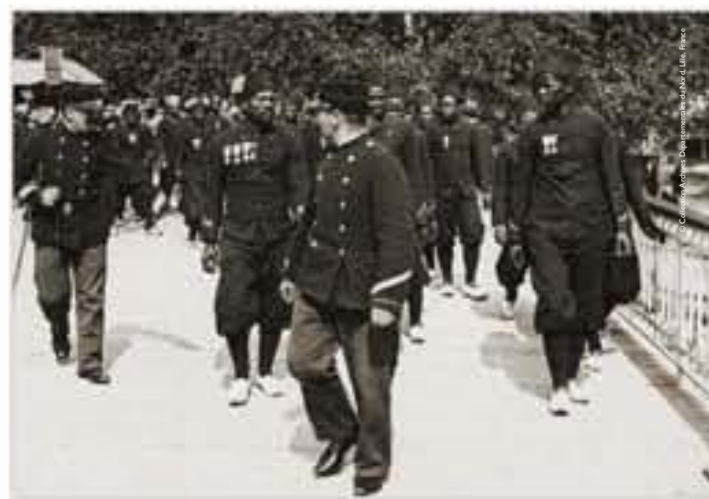
Défilé des tirailleurs, photographie, c. 1900.

« Allez visiter le village nègre, considérez les Noirs car vous les verrez à l'état de nature, ils vivent comme chez eux. [...] visitez-les comme une attraction curieuse. »