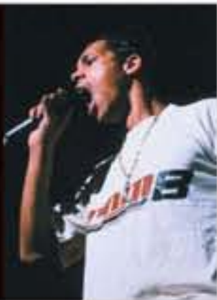
Joey Starr, concert de NTM, 1999.

En 1982, arrive en France un mouvement culturel et artistique apparu dans les ghettos noirs de New York une décennie plus tôt, le hip-hop. Popularisé au début des années 90 par des groupes majeurs comme IAM, Suprême NTM, MC Solaar ou, plus tard, Fonky Family et Oxmo Puccino, il s'appuie sur trois formes d'expression : la danse, l'art graphique (le graffiti) et la musique. Ensemble, celles-ci forment une véritable culture qui se veut l'expression des conditions de vie de la « rue ». Cette culture urbaine, avec ses codes vestimentaires (le streetwear , par exemple Com8 avec Joey Starr), son langage et ses valeurs, va influencer durablement les artistes, producteurs et le public français.