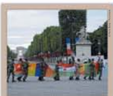
Répétitions du défilé du 14 juillet, photographie de Marie Babezy, 2010.