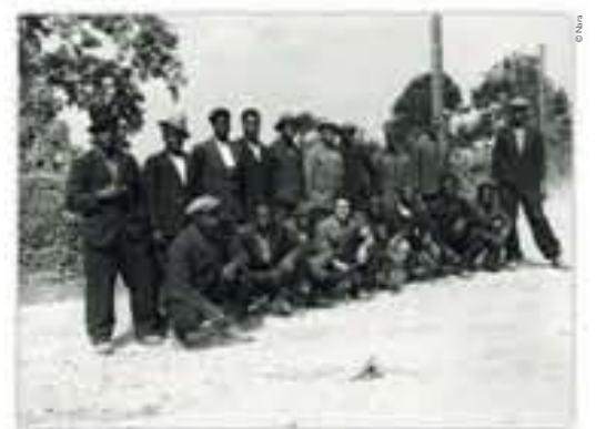
Groupe de travailleurs sénégalais évadés d'un bataillon allemand de travail ayant rejoint le maquis à Saint-Jean-aux-Bois, photographie, 1944.

Administrateur colonial d'origine guyanaise, il rallie la cause du général de Gaulle dès les premières heures de la Résistance. Quand s'annonce le Centenaire de l'abolition de l'esclavage, en 1948, le gouvernement décide de lui rendre hommage au Panthéon en compagnie de Victor Schœlcher. La cérémonie a lieu le 27 avril 1948. Gaston Monnerville rappela à cet instant que « c'est [un] message d'humanité qui a guidé Félix Éboué, et nous tous, Résistants d'outre-mer, à l'heure où le fanatisme bestial menaçait d'éteindre les lumières de l'esprit et où, avec la France, risquait de sombrer la liberté ».