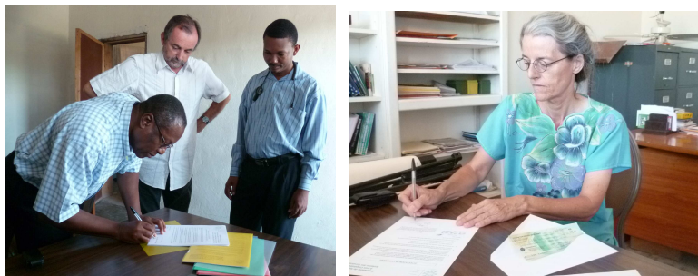
Signature du contrat le 3 mai 2012

La libération de la subvention de la Fédération Protestante de France via la Fédération Protestante d'Haïti est maintenant effective!